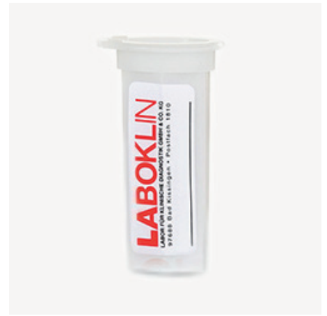
Obal na zasielanie podložných sklíčok