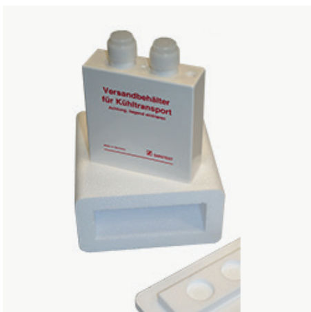
Box na chladené vzorky