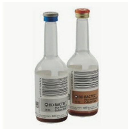
Fľaše na hemokultiváciu (set aeróby + anaeróby)