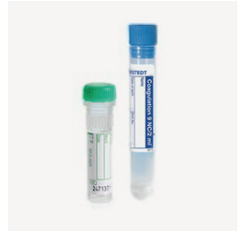
Skúmavky s citrátom (zrážanlivosť)