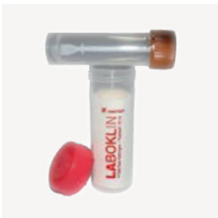
Nádoba na trus