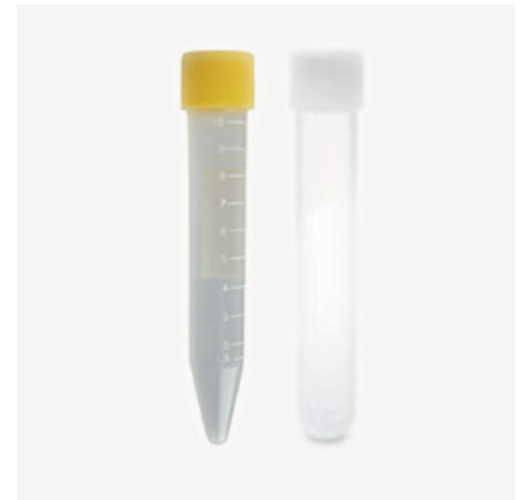
Skúmavky na moč