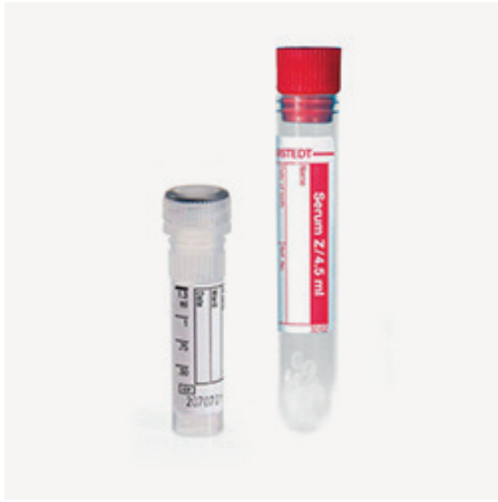
Skúmavky na sérum