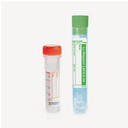
Skúmavky s heparínom