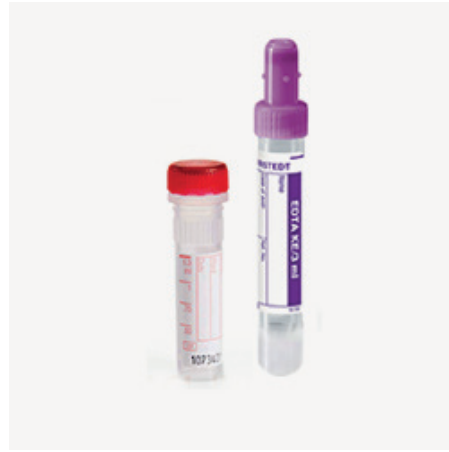
Skúmavky s EDTA (hematológia, genetika)