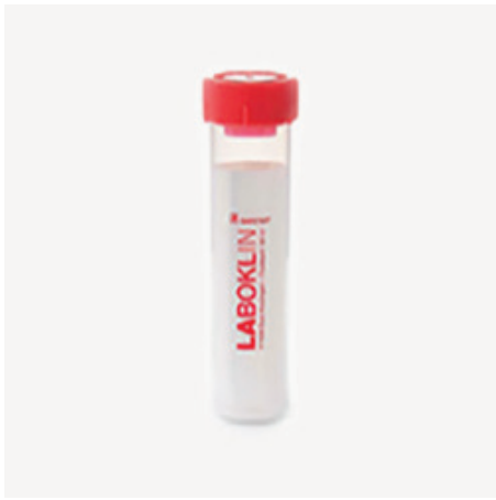
Obal na skúmavky na krv/sérum