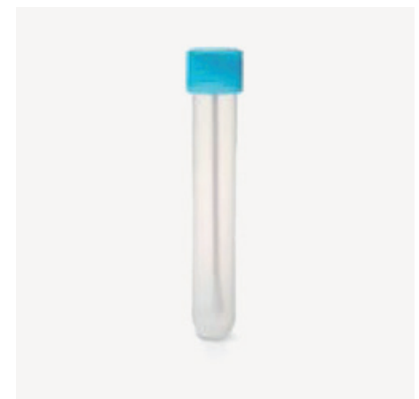
Tampón bez média