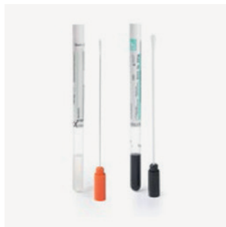
Tampóny s médiom