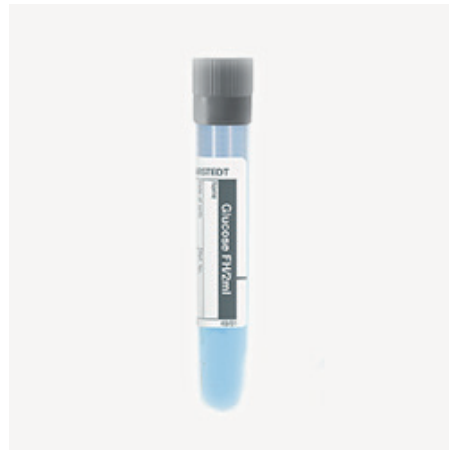
Skúmavka s NaF (glukóza, laktát)