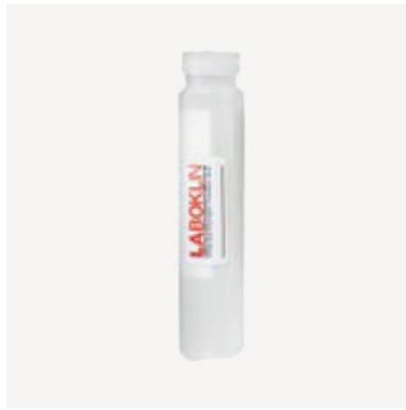
Obal na tampón