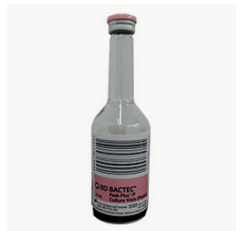
Fľaša na hemokultiváciu pediatrická (na aeróby aj anaeróby)